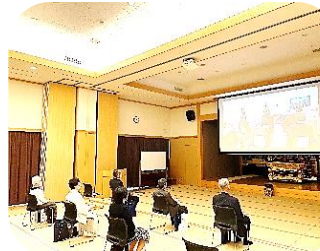
開所式の様子 於 東本願寺 仏事サポートセンター／福岡教務支所