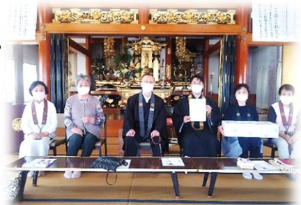
真宗寺 60 年完納表彰記念撮影