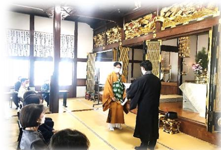
安超寺同朋の会 結成 30・50 年表彰