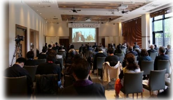
全国の療養所を web で繋いだ交流会