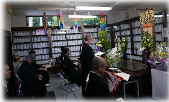
菊池恵楓園の納骨堂での「慚愧の法要」