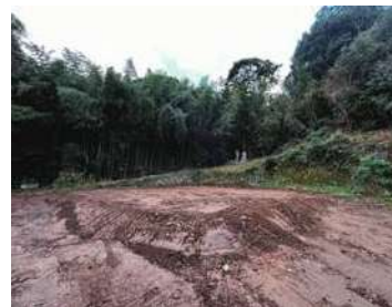
本堂が解体され更地に

← 寶山寺の須弥壇は新しく、綺麗な状態が保たれています。現在教務所が保管していますので、譲渡をご希望されるご寺院は、教務所までご連絡ください。 ※寸法等の詳細は、次月号で改めてお知らせいたします。