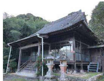
解体前の寶山寺本堂

「寺院相談室」では、このような寺院が抱える様々な課題について対応いたします。どうぞお気軽に「寺院相談室」へご相談ください。